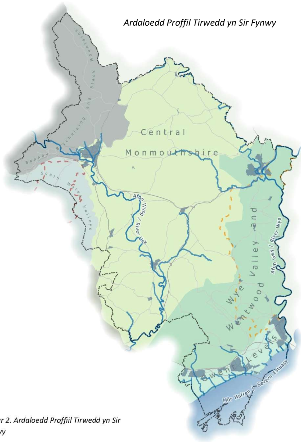
Ffigur 2. Ardaloedd Proffil Tirwedd yn Sir Fynwy