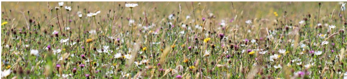
Ffigur 7 Dail blodau gwylt yn Sir Fynwy

Hoffem hefyd gynnwys astudiaethau achos o brosiectau adfer natur a gynhaliwyd gan aelodau PNLI, felly os oes unrhyw beth yr hoffech ei rannu, cysylltwch â ni.