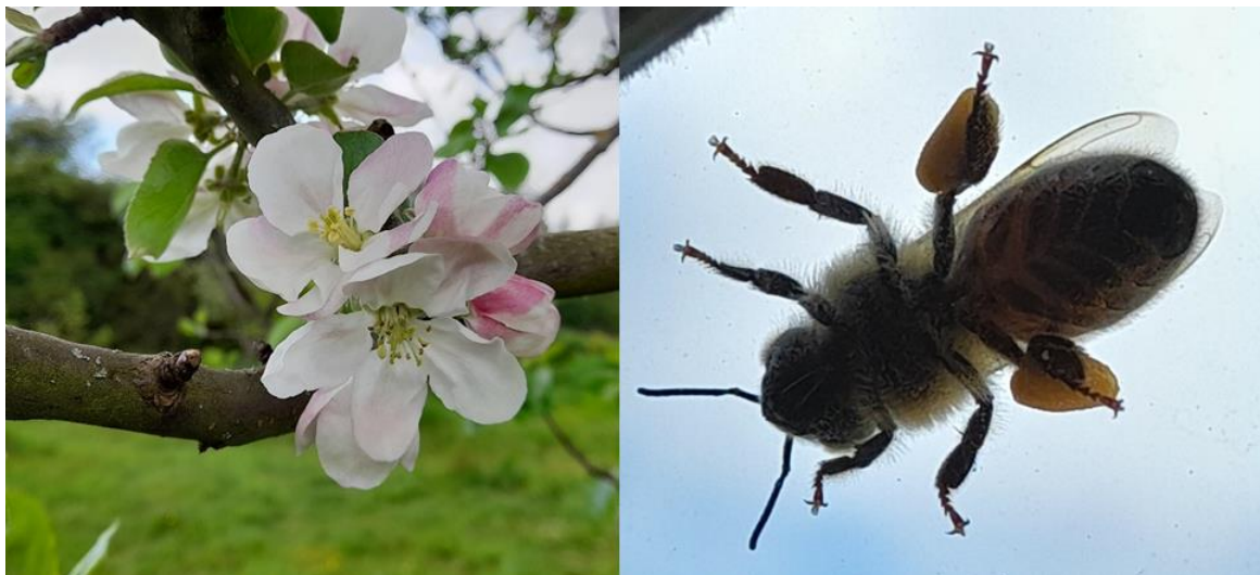
Ffigur 3 Plannu coed ffrwythau a gwenynen yn llawn pail

Y 'safleoedd cerrig camu' rydym yn canolbwyntio arnynt eleni yw: Hen Heol Henffordd (Y Fenni), Redwick Rd Park (Magwyr), Hendre Close/Rockfield Avenue a Watery Lane/Rolls Avenue (Trefynwy), a Chaeau Chwarae Rhosied (Rhosied).