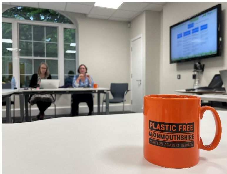
Ffigur 1 Ail-lansio'r PNLI yn Neuadd y Sir

Cafwyd trafodaeth wych am amrywiaeth o brosiectau a mentrau yn digwydd ledled y sir, gellir dod o hyd i fanylion llawn yn y cofnodion a anfonwyd drwy e-bost ar 11/08/2023.