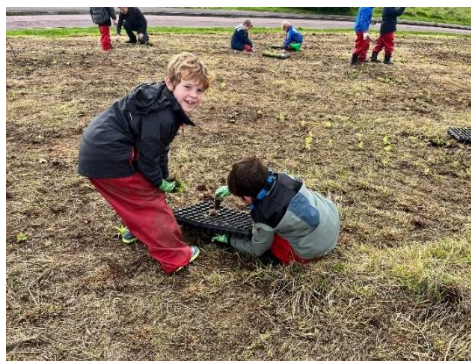
Ffigur 5 Myfyrwyr yn mynd ati

Rydym hefyd yn gobeithio trefnu diwrnod plannu plygiau arall yn Strongbow Road, man natur cymunedol arall yng Nghas-gwent gydag ysgolion cyfagos.