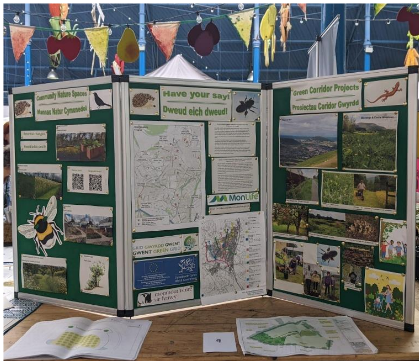
Ffigur 6 Arddangosfa Mannau Natur Cymunedol a Choridorau Gwyrdd

Ar y cyfan, roedd yn ddigwyddiad prysur ac yn gyfle gwych i gael sgysiau defnyddiol am yr hyn sy'n bwysig i drigolion o ran eu manau gwyrdd. Rydym wedi defnyddio'r wybodaeth hon i lywio ein dyluniadau ar gyfer manau natur cymunedol a safleoedd coridorau gwyrdd.