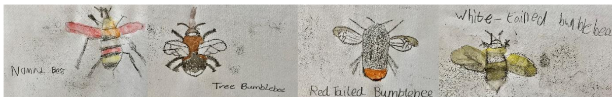
Ffigur 11 Lluniau plant o beillwyr a grëwyd yn ystod gweithdy ysgol

Mae'r holiadur yn cael ei ddatblygu ar hyn o bryd ac mae'n debygol y bydd yn cael ei anfon i ysgolion yn y flwyddyn newydd.