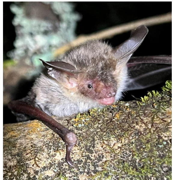
Ffigur 10 Ystum Bechstein wedi'i ddal yn Nyffryn Gwy, Medi 2023