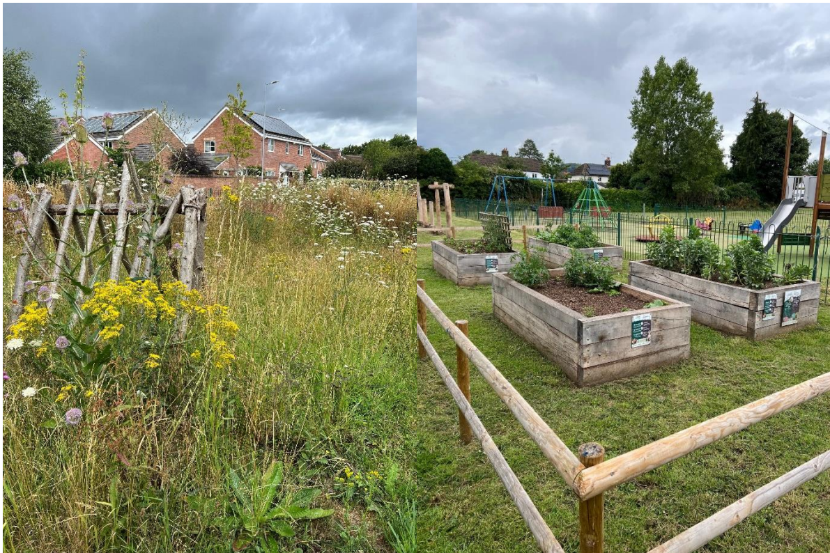
Ffigur 2 Mannau Natur Cymunedol a ddarparwyd yn 2021/22 yn Nhrefynwy trwy ariannu Lleoedd Lleol ar gyfer Natur.

Unwaith y bydd gennym y dyluniadau manwl yn ôl gan ein hymgynghorwyr, byddwn yn gallu symud ymlaen ar ymgynghoriad â ffocws terfynol ac yna cyflwyno gyda'n timau tir y flwyddyn ariannol hon. Mae'r safleoedd a ddewiswyd i'w cyflawni yn cynnwys gwelliannau fel gwelliannau glaswelltir a phlannu blodau gwylt, plannu coed a chyfleusterau tyfu bwyd cymunedol.