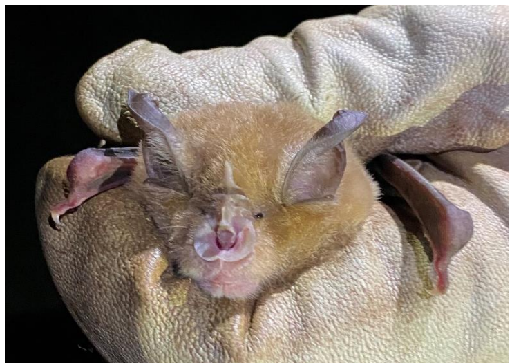
Ffigur 8 Ystlum Trwyn Pedol Fwyaf wedi'i ddal yn Wentwood, Mai 2022

Mae ystlumod Trwyn Pedol Fwyaf yn un o'n hystlumod mwy, sydd â chorff maint gellyg sy'n pwysu hyd at tua 34g. Wedi esblygu i glwydo mewn ogofâu, maent bellach i'w gweld yn defnyddio ysguboriau, tai mawr, ac eglwysi mewn tirweddau o ansawdd da sy'n gyfoethog o bryfed. Fel ystlum sy'n clwydo'n rhydd, nid ydynt yn tueddu i fod heb sylw am hir.