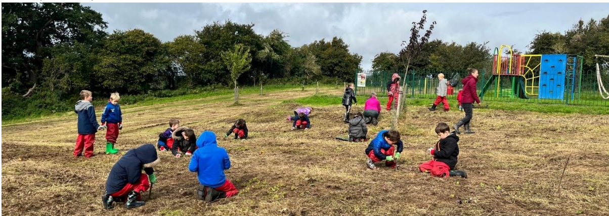
Ffigur 4 Myfyrwyr o Ysgol Gynradd Thornwell yn helpu gyda phlannu blodau gwylt.

Ym mis Hydref, ymunodd myfyrwyr o ysgol gynradd Thornwell ac ysgol gynradd y Santes Fair yng Nghas-gwent ar safle gofod natur gymunedol Coedwig Woolpitch. Gwnaeth y myfyrwyr waith gwych yn ein helpu i blannu cymysgedd o blygiau blodau gwylt brodorol i'r ardaloedd glaswelltir er mwyn darparu adnodd ar gyfer rhywogaethau peillwyr. Gweithiodd y myfyrwyr yn galed ac nid oeddent yn ofni mynd yn fwdlyd, rydym yn edrych ymlaen at weld sut mae'r planhigion yn sefydlu ac yn gwella'r fioamrywiaeth yma.