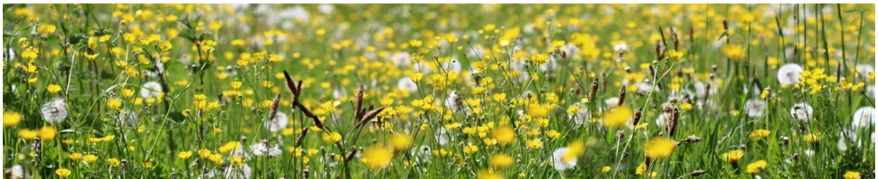
Ffigur 12 Dolydd blodau gwyllt yn Sir Fynwy

Digwyddiadau | Ymddiriedolaeth Bywyd Gwyllt Gwent